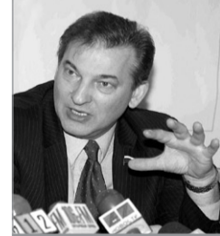
Президент Федерации хоккея России Владислав Третьяк.

«Без молебна у нас могло бы не оказаться и тех пятнадцати медалей, которые мы выиграли».