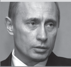
Премьер-министр России Владимир Путин.

«Я думаю, тот факт, что мы живем, это уже счастье, данное нам Всевышним. И мы всегда забываем, что жизнь конечна».