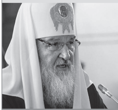
Патриарх Московский и всея Руси Кирилл.

«Пока человек живет по законам инстинкта и не полагает нравственные нормы в основу своей деятельности, он хуже зверя».