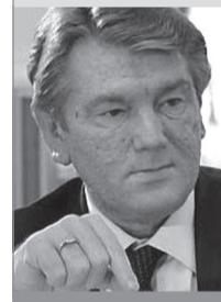
Президент Украины Виктор Ющенко.

«В Украине — четыре конфессии. В других странах — одна. Почему их должно быть четыре?»